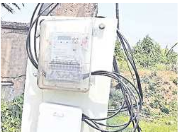
నిర్ణయానికి రావాలి' అని పీఈజీ నివేదికలో స్పష్టంచేసింది. మనుషులు రీడింగ్ తీయాలి వస్తే... జిల్లాలో మీటర్ల కంటిని చూడండి

జిల్లాలో మీటర్లకే సమాఖ్య సమస్యలు వ్యవసాయ పంపొందు మార్కెట్ ప్రాంతాల్లో ఉండటంతో శ్రీకాకుళం పైలట్ ప్రాజెక్టులో అనేక సమస్యలు వచ్చాయని పీఈజీ గుర్తించింది. ప్రకృతి శక్తుల నుంచి మీటర్లను కాపాడటం కష్టమవుతోందని తెలిసింది. జిల్లాలో మీటర్ల కంటే స్మార్ట్ మీటర్లు సన్నుతంగా ఉంటాయి కాబట్టి, మరిన్ని ఎక్కువ సమస్యలు వస్తాయని ఇంధనశాఖ ప్రత్యేక ప్రధాన కార్యదర్శి డి.పి.ఎం.లకు అప్రమత్తం చేశారు. రాష్ట్రంలో వ్యవసాయేతర విద్యుత్ మీటర్ల సమగ్రత 95% ఉండే, శ్రీకాకుళం జిల్లాలో అమర్చిన మీటర్ల సమగ్రత 55%.. అంతకంటే తక్కువగా నమోదైంది. ఏడాది కాలంలో మీటర్లు ఏవలమడం, కాలిపోవడం 12-21 శాతంగా నమోదైంది. 'శ్రీకాకుళం జిల్లాలో' సేకరించిన సమాచారం ఆధారంగా రాష్ట్రమంతా వ్యవసాయ మోటార్లకు మీటర్లు అమర్చడంపై నిర్ణయం తీసుకోవాలనుకుంటే మరొక కాలం ఆగాలి. శ్రీకాకుళంలో వ్యవస్థ గాడిన పడేవరకూ వేచి ఉండి, మరి కొన్నేళ్లు పరిశీలించాకే ఒక